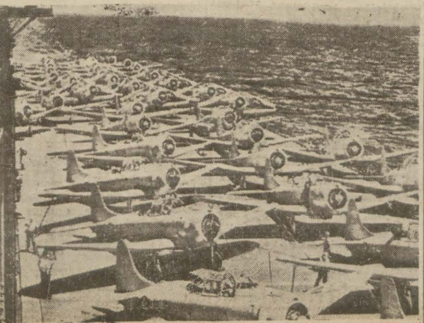
Bir Amerikan uçak gemisinin güvertesinden bir görünüş

Bazı iddialara göre İngilizler bu (Devamı 5 inci sayfa)