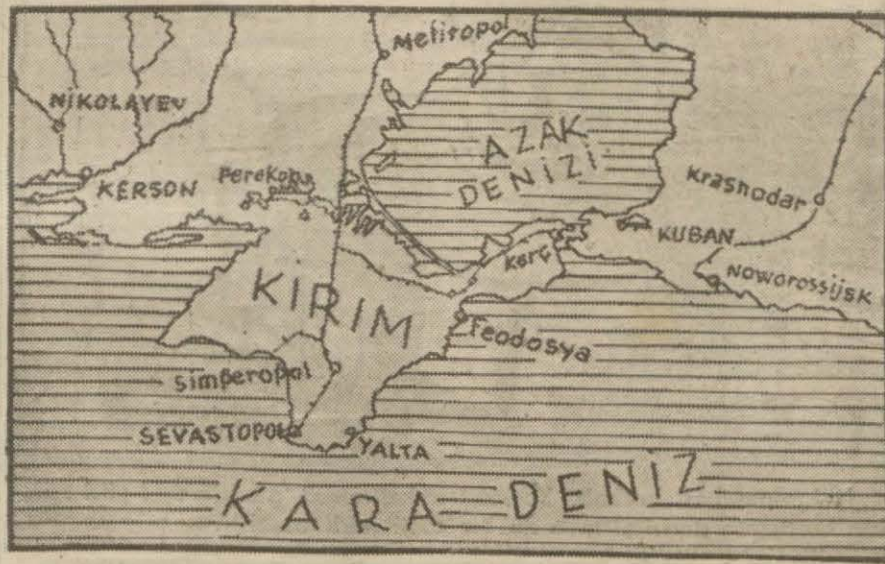
Kırım şibheçezresini ve Sivastopolu gösterir kroket

Dutch Harbour'da Londra 10 (A.A.) — Japon imparatorluk umumî kararınının rad (Devamı 5 inci sayfa)